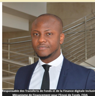
Responsable des Transferts de Fonds et de la Finance digitale Inclusive, Mécanisme de Financement pour l'Envoi de Fonds, FIDA

Comme d'habitude, n'hésitez pas à nous envoyer vos questions, commentaires et suggestions à remittances.morocco@ifad.org