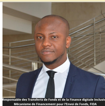
Responsable des Transferts de Fonds et de la Finance digitale Inclusive, Mécanisme de Financement pour l'Envoi de Fonds, FIDA

Alors que nous vous tenons informés de derniers développements de l'écosystème Sénégalais des envois de fonds, ainsi que de nos activités pour les éditions suivantes du bulletin d'information, nous souhaitons vous rappeler que les places se remplissent rapidement pour le prochain Sommet du GFRID qui se tiendra du 14 au 16 juin à l'ONUN . Plus de détails concernant l'inscription et la planification sont fournis dans ce bulletin.