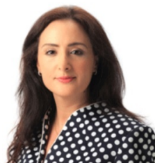
Responsable des Transferts de Fonds et de la Financement Digitale Inclusive, Mécanisme de Financement pour l'Envoi de Fonds, FIDA

Comme à l'accoutumée, vous trouverez ci-après notre sélection d'articles. En vous souhaitant une agréable lecture, toute l'équipe et moi-même restons à votre entière disposition pour toute information, ou éclaircissement via l'adresse mail suivante : remittances.morocco@ifad.org