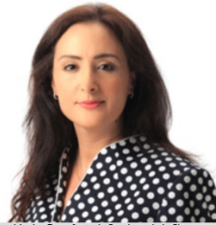
Responsable des Transferts de Fonds et de la Financement Digitale Inclusive, Mécanisme de Financement pour l'Envoi de Fonds, FIDA

Comme à l'accoutumée, notre présente newsletter mensuelle regroupe une sélection de nouvelles nationales et régionales.