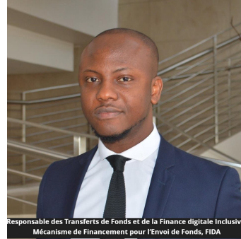
Responsable des Transferts de Fonds et de la Finance digitale Inclusive, Mécanisme de Financement pour l'Envoi de Fonds, FIDA

C'est dans cette optique nous organisons le 26 Septembre prochain une réunion sur la thématique « Les considérations LCB/FT relatives à la Norme ISO 20022 pour l'interopérabilité effective entre les paiements nationaux et internationaux » afin de permettre à l'ensemble des acteurs impliqués dans le secteur du transfert international de mieux comprendre les implications de la lutte contre le blanchiment d'argent de cette norme incontournable pour tout projet d'interopérabilité.